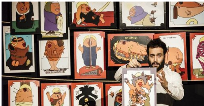
L'asta del Santo – sabato 25 luglio - Rudiano